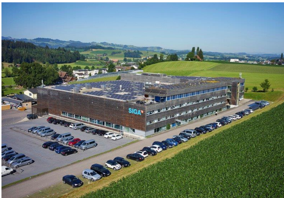
SIGA hovedkvarter og fabrikk i Ruswil, Sveits